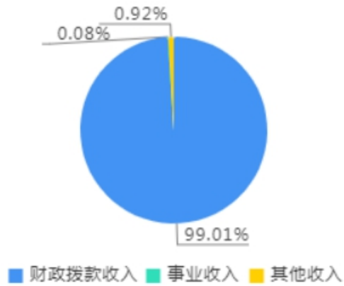
本年收入决算结构图