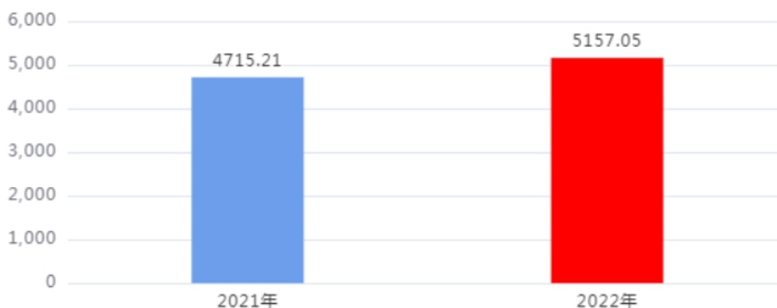
收、支决算总计变动情况图（单位：万元）

2022年度收、支总计5,157.05万元。与2021年度相比，收、支总计各增加441.84万元，增长9.37%。主要是一是专项资金项目调整；二是人员经费变化。