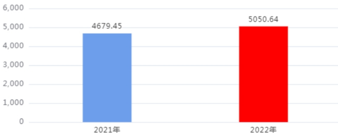
一般公共预算财政拨款支出决算变动情况图（单位：万元）

2022年度一般公共预算财政拨款支出5,050.64万元，占本年支出合计的97.94%。与2021年度相比，一般公共预算财政拨款支出增加371.19万元，增长7.93%。主要是一是专项资金项目调整；二是人员经费变化。