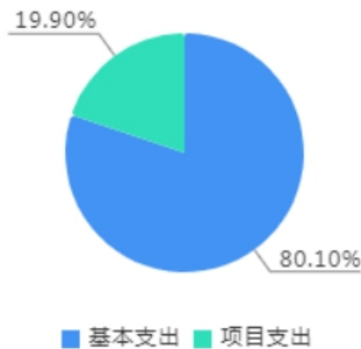
本年支出决算结构图

本年支出合计5,157.05万元，其中：基本支出4,130.58万元，占80.10%；项目支出1,026.48万元，占19.90%。