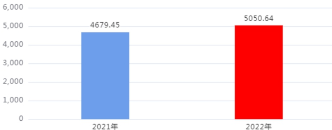
财政拨款收、支决算总计变动情况图（单位：万元）